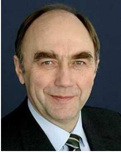
Dr. Christoph Bergner