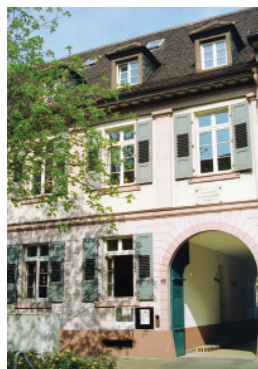
Ökumenisches Migrationszentrum Stephaniensstraße 16