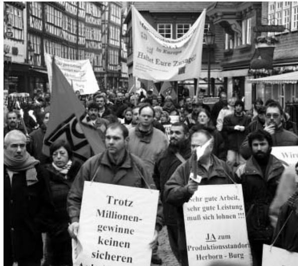
Menschen in Herborn kämpfen um den Erhalt von Arbeitsplätzen im AEG-Werk.

( ) Haben wir Anlass, in einem Buß- und Betttagsgottesdienst über Armut und Reichtum laut nachzudenken? Lässt sich eine schärfer werdende Ungleichverteilung gesellschaftlicher Güter ausmachen?