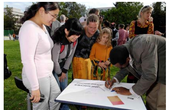
Foto von der Interkulturellen Woche 2007 im Dessauer Stadtpark: "Dicht umlagert war der Stand, an dem man seinen Namen auf arabisch oder chinesisch aufschreiben lassen konnte" vom 22. September 2007; Quelle: MZ-Foto: Lutz Sebastian, Lokalausgabe Dessau-Roßlau

Darüber hinaus fanden eine Vielzahl an Andachten, ökumenischen Gottesdiensten und Friedensgebeten, Dialogen zwischen Christen und Muslimen statt.