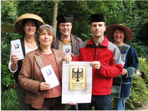
Foto aus der Interkulturellen Woche 2007 in Jülich: "Behütete Nordfriesen"; Quelle: Jörg von Berg, Husumer Nachrichten

Als Angebot für Ihre Ideensammlung vorab schon einmal eine kleine Aufzählung von Veranstaltungen, auf die wir bei der Auswertung der Interkulturellen Woche 2007 stießen.