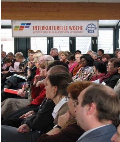
(Foto: Teilnehmer/innen bei der Vorbereitungs- tagung in Magdeburg, 1. und 2. Februar 2008)

Geschäftsstelle: Postfach 160646 · 60069 Frankfurt am Main · Telefon: 069/230605 · Telefax: 069/230650, E-Mail: info@interkulturellewoche.de ; Internet: www.interkulturellewoche.de