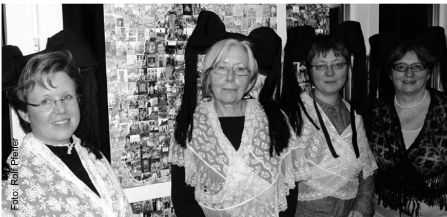
Die Landessynodalen der Kirchenbezirke Lörrach und Schopfheim in der traditionellen Tracht des Markgräflerlandes

■ Fast schon einer Liebesheirat hat sich der neue Kirchenbezirk „Markgräflerland“ zu verdanken. Der nun insgesamt 82.000 Evangelische zählende Bezirk wird gebildet aus den bisherigen Kirchenbezirken Lörrach und Schopfheim. Durch die Landessynode wurde die Fusion nun endgültig besiegelt. Seit 2008 gab es Bemühungen, in dieser Region der Landeskirche eine einheitlichere Struktur zu schaffen. Da sich die Betroffenen schnell einig waren, konnte sehr konstruktiv eine Lösung gefunden