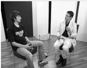
... im Gespräch