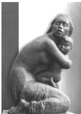
Günther Hummel Angst, Bronze, 1991