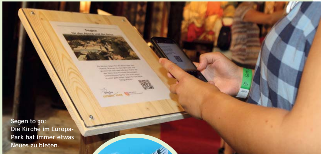
Segen to go: Die Kirche im Europa-Park hat immer etwas Neues zu bieten.

Gemeinsam mit dem ehrenamtlichen Team, das die Kirche im Europa-Park mit trägt, entwarf sie in mehreren Zoom-Sitzungen ein kontaktloses Alternativprogramm. Mehrere Stationen zum Thema „Segen“ entstanden in der Stabkirche im Skandinavischen Themenbereich. In einem kleinen Quiz geht es um Segenswünsche, die sich in Alltagsbegriffen wie „Ade und Tschüss“ verbergen. Zu einem von einem polnischen Künstler gefertigten Engel wurden zwei Segens-Geschichten geschrieben. Ein Text setzt sich mit dem Aaronitischen Segen auseinander, es gibt einen Reisesegen zum Mitnehmen, und wer möchte, bekommt ein Segensband. Die Texte lassen sich per QR-Code kontaktlos absca-