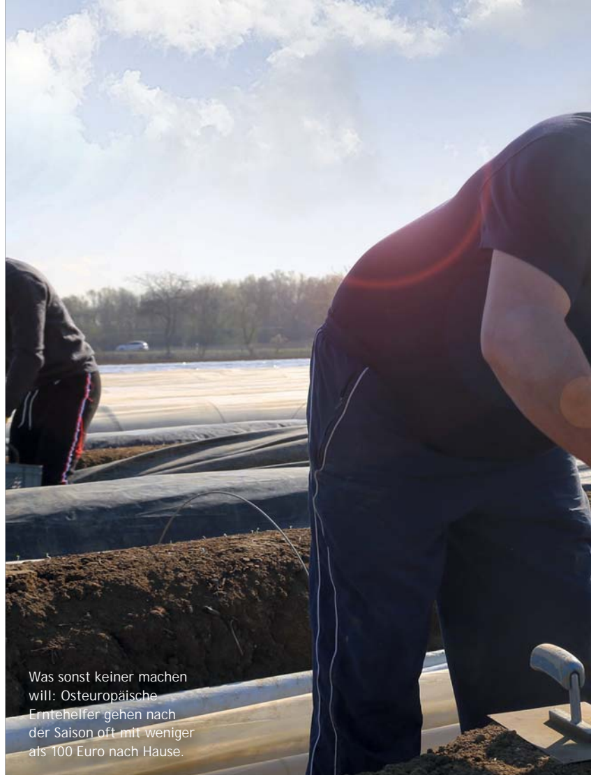
Was sonst keiner machen will: Osteuropäische Erntehelfer gehen nach der Saison oft mit weniger als 100 Euro nach Hause.

„Faire Mobilität Mannheim“ ist ein Projekt der badischen Landeskirche in Kooperation mit dem DGB