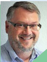
SWR4 Abendgedanken KR Axel Ebert

„ Angst bringt dazu, etwas zu tun. So haben wir eine Solaranlage setzen lassen. Trotzdem kommt manchmal die Angst. „Der Herr ist mein Hirte.“ Das hilft gegen Angst. Am Ende ist Gott es, der die Zukunft in seiner Hand hält. “