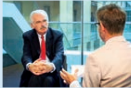
... im Gespräch