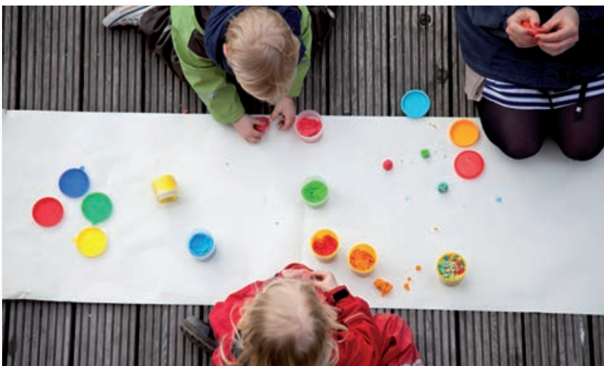
Die Landeskirche stockt ihre Mittel für die Betreuung von Kleinkindern auf.