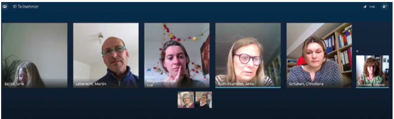
Teambesprechung der Abteilung „Frauen, Männer, Geschlechterdialog“