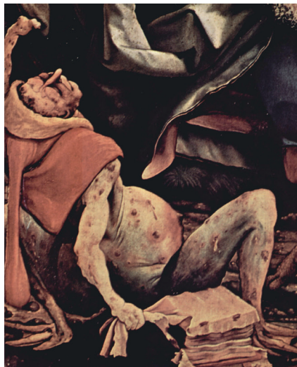
Mathis Gothart Grünewald

Stattdessen erzählt Jesus das Gleichnis vom Feigenbaum, der keine Frucht trägt. Der Gärtner trotzt dem Besitzer des Baumes eine Zukunft für diesen Feigenbaum ab, durch Geduld und Hoffen, aber auch ganz nüchtern durch Hacken und Düngen. So öffnet sich mit Herz und Vernunft ein Weg in die Zukunft.