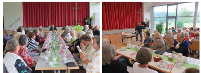
Mundartnachmittag beim Ökumenischer Seniorennachmittag Sinsheim 2016