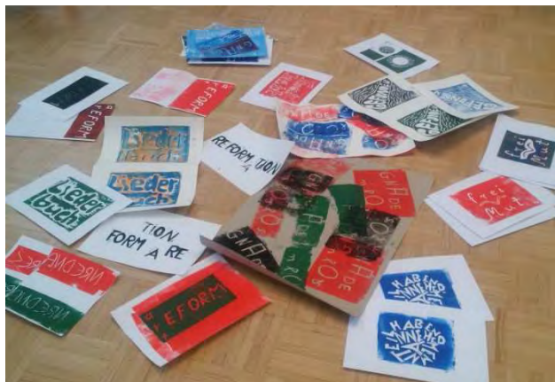
„Druck erzeugen“ Kulturführerschein Reformation heute

Der Kulturführerschein „Reformation heute“ bietet die Möglichkeit, sich kreativ-schöpferisch mit den bis heute aktuellen Impulsen aus der reformatorischen Bewegung auseinanderzusetzen. Anlässlich des Reformationsjubiläums werden in diesem Weiterbildungskurs exemplarisch Themen dazu erlebbar. Zum Programm gehören Museums- und Atelierbesuche ebenso wie Exkursionen zu Orten kulturellen und kirchlichen Geschehens. Der Kulturführerschein „Reformation heute“ wurde in Kooperation mit dem Evangelischen Erwachsenenbildungswerk Nordrhein in Düsseldorf konzipiert.