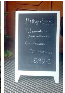
Das Kochteam vom offenen Mittagstisch in Leimen