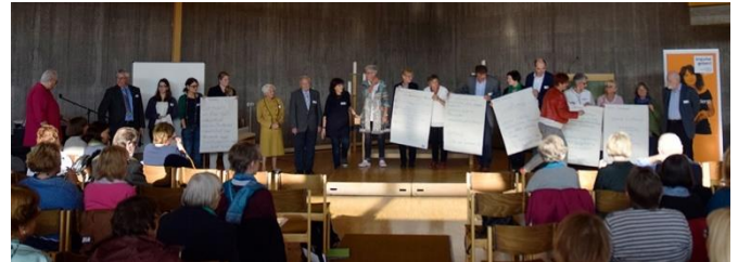
Das Plenum mit den Beteiligten