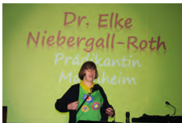
Über sich hinaus gewachsen · Mannheimer Slammerin