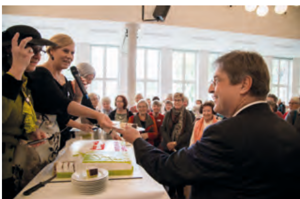
Gutes für Leib und Seele · Jubiläumstorte