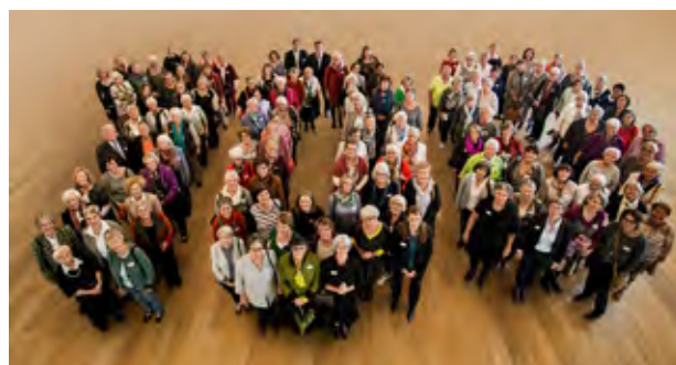
(mindestens) 100 engagierte Frauen · Jubiläumstag