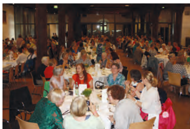
Zuhören, reden, essen, vernetzen · Frauenmahl Konstanz