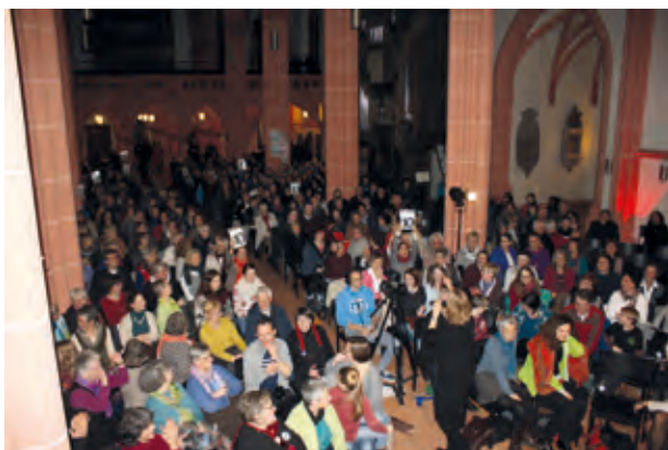
Was für ein Publikum! · FrauenPreacherSlam

Der FrauenPreacherSlam im Februar in Heidelberg, das Speed-Dating und das Frauenmahl auf dem Konstanzer Konzil im Juni und der Jubiläumstag im Oktober in Karlsruhe waren die Höhepunkte des Jubiläumsjahres. Viele schöne Fotos sind auf diesen Veranstaltungen entstanden; hier erinnern wir uns noch einmal!