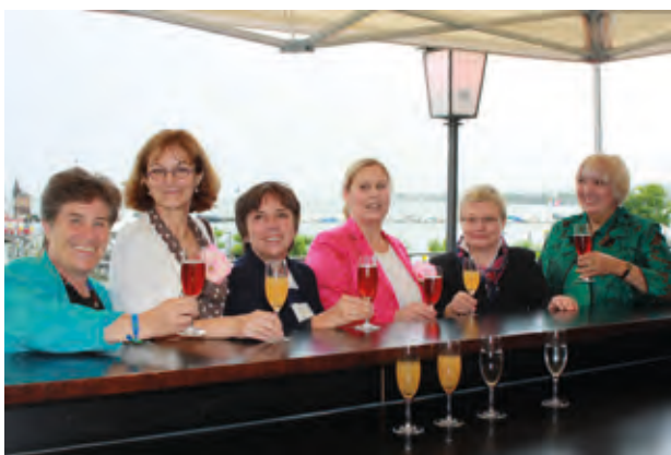
leidenschaftlich getalkt · Frauen im Konzil