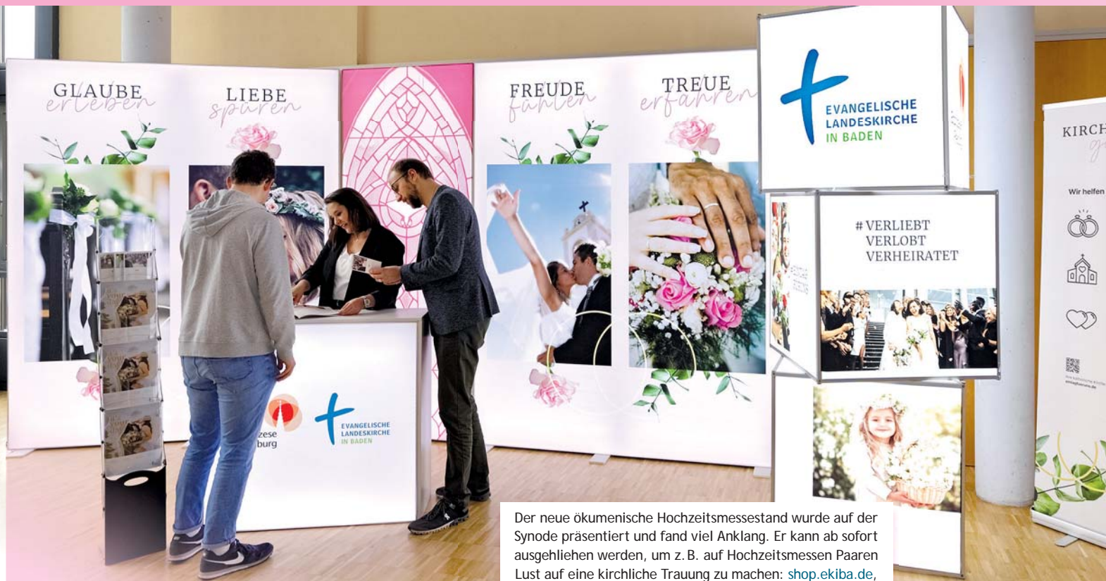
Der neue ökumenische Hochzeitsmessenstand wurde auf der Synode präsentiert und fand viel Anklang. Er kann ab sofort ausgeliehen werden, um z. B. auf Hochzeitsmessen Paaren Lust auf eine kirchliche Trauung zu machen: shop.ekiba.de , Stichwort „kirchlich heiraten“.