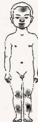
Abbildung 2 Sturzverletzungen