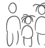
Abbildung 1 Mißhandlungsverletzungen