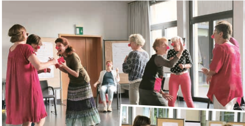
Die Teilnehmerinnen in Aktion.

Der aktuelle Kurs war in den coronageprägten Jahren eine besondere Herausforderung, denn manche Wochenendmodule mussten auf digital umgestellt werden – ein Fernstudium im wahrsten Sinne des Wortes. Das Fernstudium bietet Frauen und Männern die Möglichkeit, Theologie wissenschaftlich wie erfahrungsbezogen kennen zu lernen. Es umfasst die Module Grundsatzfragen, Bibel, Gott, Jesus Christus, Kirche, Ethik und Spiritualität, immer unter der Fragestellung: In welchem historischen und sozialen Kontext wird diese Theologie vertreten? Was bedeutet sie aus Frauen- und Männerperspektive? Außerdem macht es mit Klassikerinnen bekannt und mit neuen Tendenzen wie der intersektionalen und queeren Theologie.