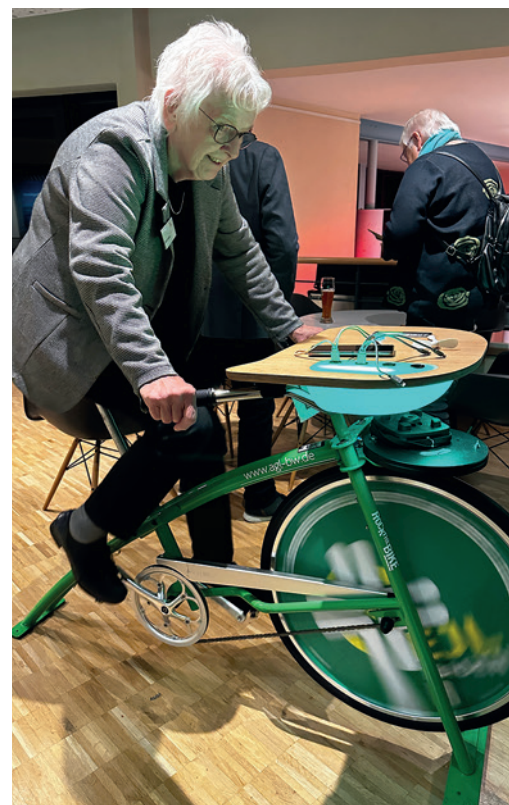
Wie viel Schwung braucht es, um ein Handy zu laden? Die Evangelische Landjugend widmet sich dem Thema Nachhaltigkeit.