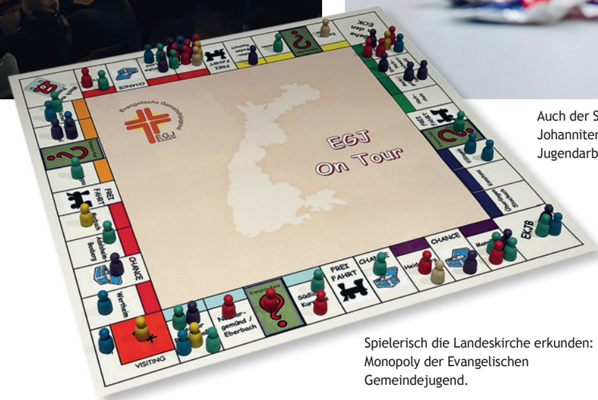
Spielerisch die Landeskirche erkunden: Monopoly der Evangelischen Gemeindejugend.

zirk Baden-Baden und Rastatt sei beispielsweise ein Ziel, dass jeder Konfirmand und jede Konfirmandin während der Konfi-Arbeit mindestens fünf bis sechs Mal Kontakt mit der bezirklichen Jugendarbeit habe. Sei es bei Bezirksjugendgottesdiensten, bei Abenteuertagen, beim Konfi-Cup oder bei eigenen Konfi-Modulen der Bezirksjugend. Unter dem Motto „Dein Sommer – deine Wahl“ würden in ihrem Bezirk in diesem Sommer sechs sehr unterschiedliche Kurzfreizeiten angeboten, frisch Konfirmierte bekommen Rabatt, wenn sie an einer davon teilnehmen. „Wir müssen die Konfis als Kunden sehen.