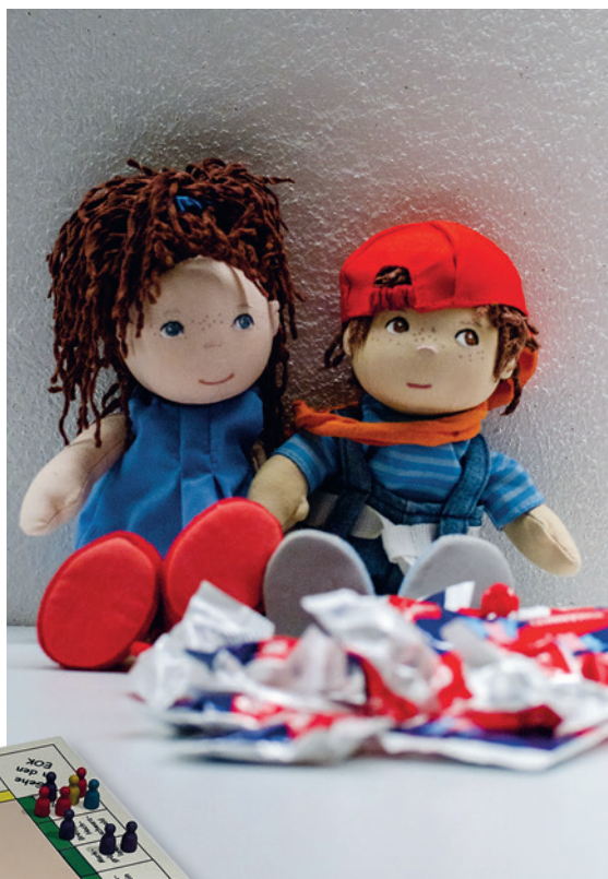
Auch der Schulsanitätsdienst der Johanniter ist Teil evangelischer Jugendarbeit.