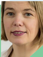
SWR 3, Gedanken Ute Niethammer, Freiburg

„ Gott könnte als erster Gewerkschafter zählen! Die Idee, dass mindestens ein Tag der Woche völlig arbeitsfrei sein soll, stammt schließlich laut biblischer Erzählung von Gott selbst. Gott hat am siebten Tag der Schöpfungswoche geruht. Und erst mit diesem Ruhetag war die Schöpfung vollkommen.“