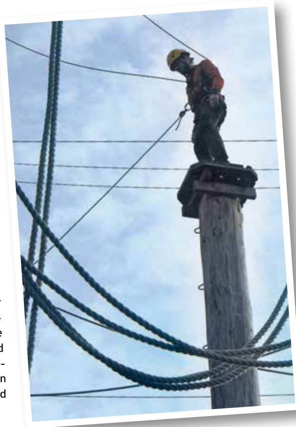
Christian Rettig kurz vor dem Sprung in die Tiefe

Eröffnet wurde der Seilgarten 2002. Im vergangenen Jahr war dann klar, dass die Holzstämme saniert bzw. durch neue ersetzt werden müssen.