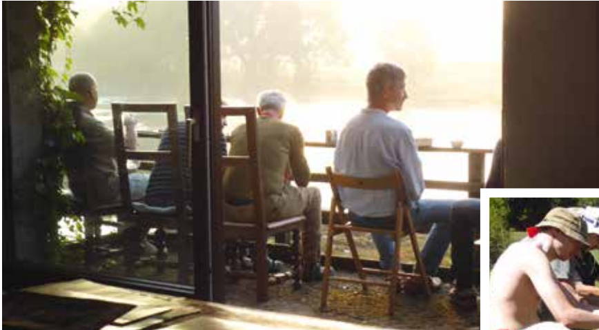
Ob beim Bau einer Schwitzhütte (r.) oder beim Hüttenwochenende am Bodensee: Auch Männer sind „hungrig“ nach spirituellen Themen.