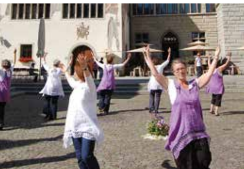
... wird an allen Ecken gefeiert.

Der Bodenseekirchentag beginnt am Freitagabend im Konzilsgebäude in Konstanz mit dem Vortrag von Margot Käßmann „2017 – Was gibt es da zu feiern?“; beendet wird er mit einer Matinée zum Thema „2017: Einheit nach 500 Jahren?“ mit Heiner Geißler und Volker Leppin. Die Zeit dazwischen ist gefüllt mit 150 Veranstaltungen von Vorträgen und Foren bis hin zu Gesprächen und Workshops in kleinen Gruppen, Ausstellungen, Theater und Bibelarbeit. Zuhören oder mitsingen kann man bei musikalischen Angeboten aus den Bereichen Klassik, Jazz und christliche Popmusik. Die Kirchentagsthemen sind Ökumene, interreligiöser Dialog, Gerechtigkeit/