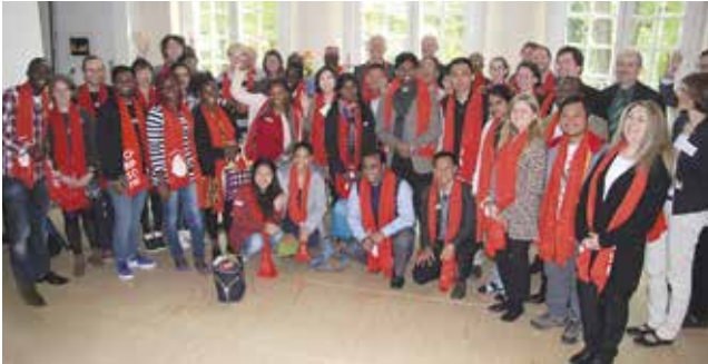
Gäste aus den Partnerkirchen beim Badischen Ökumenetag am 30. April 2016