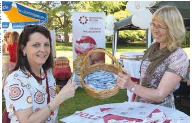
Konstanz allein ist schon eine Reise wert. Und zur Zeit des Bodenseekirchentags (hier 2012) ...