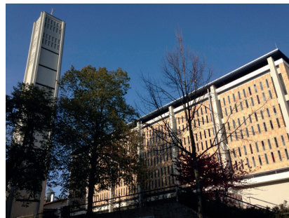
Stadtkirche Altarraum - Michaelskapelle Ebersteinburg Dietrich-Bonhoeffer-Saal - Lutherkirche mit Sternenhimmel Pauluskirche Altarraum - Pauluskirche mit Saal