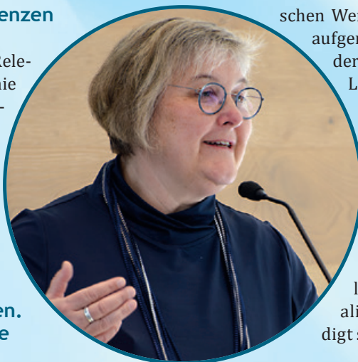
Landesbischöfin Heike Springhart

Die Landesbischöfin begrüßte die Gründung von bundesweit unabhängigen regionalen Aufarbeitungskommissionen von sexualisierter Gewalt, abgekürzt URAK: „Unabhängige Aufarbeitung ist ein unbedingt nötiger Baustein für einen entschiedenen und an den Erfahrungen von Betroffenen orientierten Umgang mit dem Skandal von sexualisierter Gewalt in Kirche und Diakonie.“ Die URAK, die den Bereich der badischen Landeskirche und der Landeskirche der Pfalz sowie deren Diakoni-