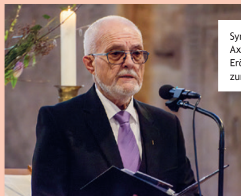
Synodalpräsident Axel Wermke beim Eröffnungsgottesdienst zur Frühjahrstagung

B eschlossen haben die Delegierten auf dieser Frühjahrstagung auch, dass die Zahl der gewählten Landessynodalen von bisher 59 auf 55 sinkt. Damit sinkt die Gesamtgröße des Plenums von bisher 74 auf 70 Personen. Verbunden mit dieser Reduktion ist eine Änderung des Wahlsystems. Unabhängig von seiner Größe wird zwar jeder Kirchenbezirk weiterhin mindestens zwei gewählte Synodale stellen. Die weiteren Wahlmandate werden anschließend nach dem Sainte-Laguë-Verfahren an die Kirchenbezirke nach ihrer Größe vergeben. Dabei garantiert der hinterlegte Algorithmus einerseits, dass jeder Synodale dieselbe Anzahl von Kirchenmitgliedern vertritt. Andererseits ist künftig eine weitere Anpassung der Delegiertenzahl möglich, ohne dass das Wahlgesetz erneut angepasst werden müsste. Zu den 55 gewählten Delegierten der nächsten Landessynode kommen wie bisher elf berufene Mitglieder sowie vier Jugendvertreter.