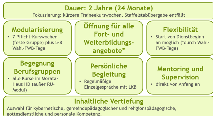
Übersicht neues Trainee-Konzept_Stand 09.2025

Das Trainee-Konzept wird angepasst: Nach dem Motto der Jahreslosung „Prüft alles und das Gute behaltet...“ (1. Thess 5,21) wird das Traineeprogramm derzeit reflektiert und umstrukturiert, um den sich verändernden Strukturen und Bedarfen der neuen Kolleg*innen gerecht zu werden. Neue Diakon*innen sollen weiterhin von Anfang an professionell begleitet und für ihren Dienst gestärkt werden.