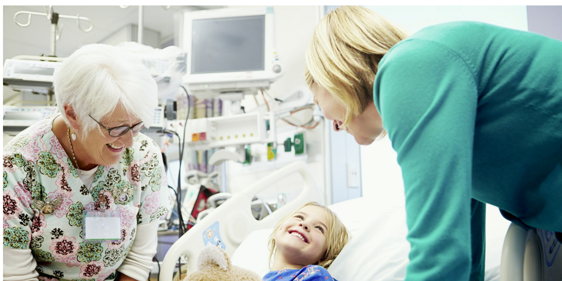
Die Empfänger*innen der Kollekten freuen sich über eine zeitnahe Überweisung: Das ist die Grundlage für ihre Arbeit!

Kollekten, die nicht bei der Kirchengemeinde bleiben, werden im Sachbuch 51 „verwahrt“. Das heißt: sie tauchen nicht im ordentlichen Haushalt der Kirchengemeinde auf, sondern werden an den Kirchenbezirk, die Landeskirche oder andere Empfänger*innen weitergeleitet.