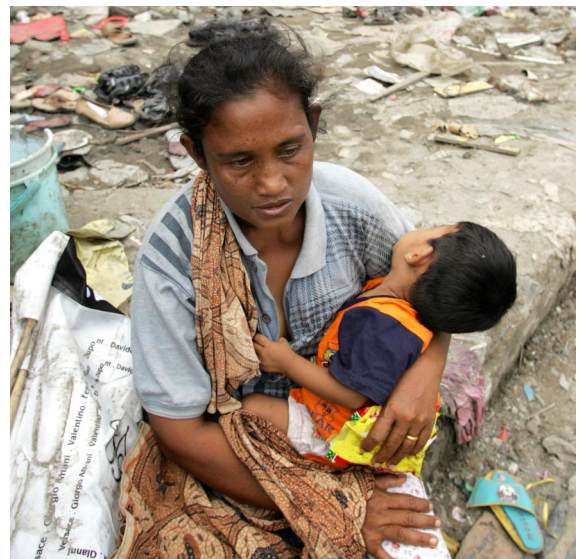
Bei Naturkatastrophen (wie dem Tsunami 2018 in Sulawesi, Indonesien) oder den verheerenden Überschwemmungen in Südindien 2018/19 ist schnelle Hilfe erforderlich.