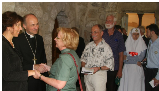
„Ökumene und Auslandsarbeit“ konkret: die Evangelische Gemeinde deutscher Sprache in Jerusalem.

Im Kollektenplan bereits enthalten sind jährlich vier EKD-Pflichtkollekten, die deutschlandweit erbeten werden.