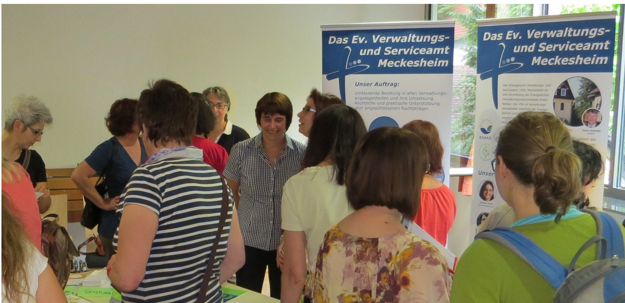
Die Verwaltungs- und Serviceämter (in der Fläche) oder die Kirchenverwaltungsämter (in den Großstädten) sind Ihre kompetenten Ansprechpartner.

Kollekten und Opfer werden grundsätzlich von Spenden unterschieden. Letztere werden unter 22xx gebucht.