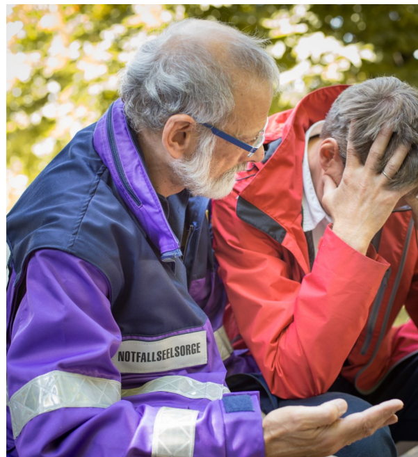
Übergemeindliche Dienste wie die Notfallseelsorge sind auf die Finanzierung aus Kollektengeldern dringend angewiesen.

te und Werke eine wesentliche Einnahmequelle, welche durch eine normierte Zuweisung ausgeglichen werden müsste. Gleichzeitig würde ein wichtiger Berührungspunkt zur gemeindlichen Lebenswelt fehlen.