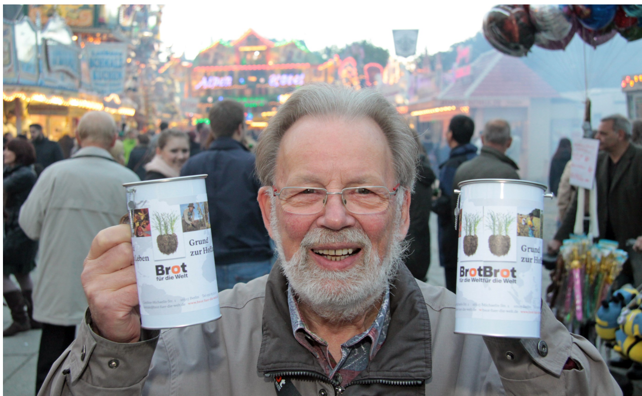
Ohne Ehrenamtliche nicht zu schaffen: Die Sammlungen für Diakonie und Brot für die Welt.

in der eigenen Gemeinde. Drei­ßig Prozent kommt der Diakonie im Kirchenbezirk zu­gute. Es lohnt sich also, als Gemeinde und Bezirk tatkräftig an dieser Aktion mitzumachen. Früher zogen in vielen Gemeinden Sammlerinnen und Sammler von Tür zu Tür und hielten durch diese Besuche zugleich den Kontakt zu den Gemeindegliedern. Heute ist die Sammlung meist nicht auf eine einzige Woche beschränkt, denn die meisten Gemeinden werben vor allem durch Flyer im Gemeindebrief im Frühjahr (Passion/Ostern/Pfingsten) über einen längeren Zeitraum. Noch immer ist die Woche der Diakonie die wichtigste Sammelaktion neben Brot für die Welt. Die Erträge dieser verpflichtenden Sammlungen und Kollekten werden über die Dekanate an die Landeskirchenkasse abgeführt.