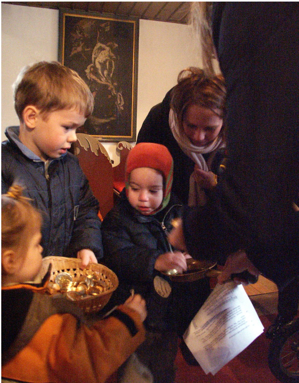
Früh übt sich: Kollektensammlung in einem Kindergottesdienst.

Umgekehrt wäre es aber genauso wünschenswert, wenn Kinder- und Jugendthemen auch bei den Kollekten der Erwachsenengottesdienste eine Rolle spielen.