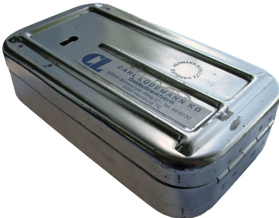
Die gute alte „Geldbombe“ hat leider fast überall ausgedient.

Die Verwaltungsvorschriften sollen demnächst überarbeitet werden, um Verfahrenswege zu beschreiben, die den veränderten Rahmenbedingungen gerecht werden. Wir halten Sie auf dem Laufenden.