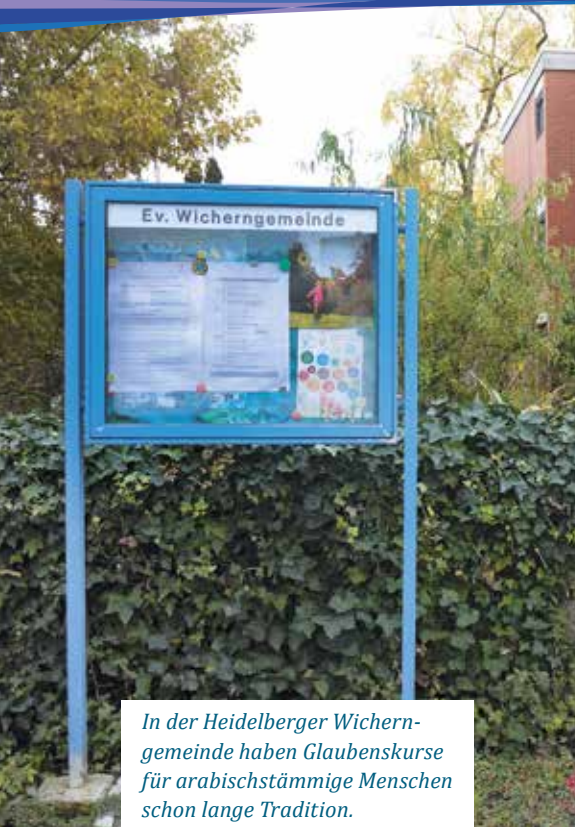
In der Heidelberger Wichern- gemeinde haben Glaubenskurse für arabischstämmige Menschen schon lange Tradition.