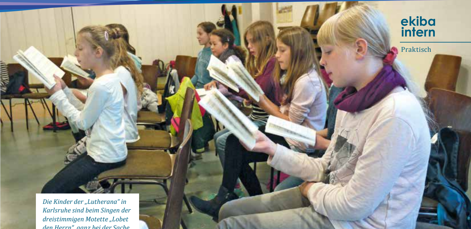
Die Kinder der „Lutherana“ in Karlsruhe sind beim Singen der dreistimmigen Motette „Lobet den Herrn“ ganz bei der Sache.