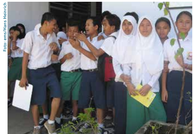
Indonesische Partnerkirchen bringen junge Christen und Muslime zusammen.

Für diese und ähnliche Projekte vor Ort brauchen unsere Partnerkirchen unsere Unterstützung. Bitte helfen Sie mit!