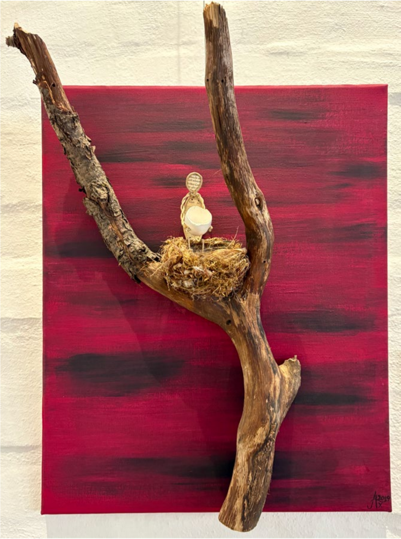
Axel Ude, Installation in Gehrden