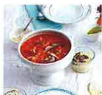
Fischsuppe „Bodensee“ von geräuchertem Felchen

Am 06. März 2015 um 19:00 Uhr lade ich Sie ein, bei mir, der Dekanin des Evangelischen Kirchenbezirks Konstanz, ein Vier-Gänge-Menü mit einer unbestimmten Zahl von Sternen, die Sie selbst vergeben können, zu genießen.