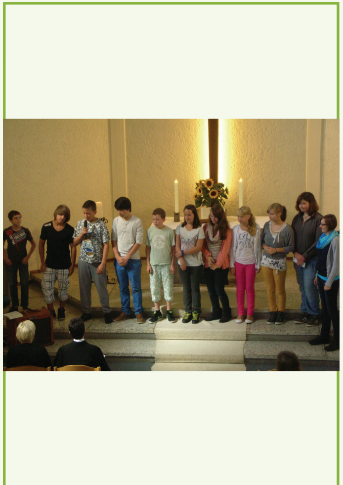
Oben: Digitale Angebote - Streaming der Gottesdienste Links: Ökumene Rechts: Jungschar im Gottesdienst