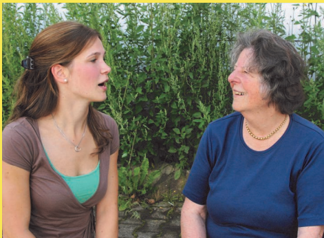
jung und alt im Gespräch