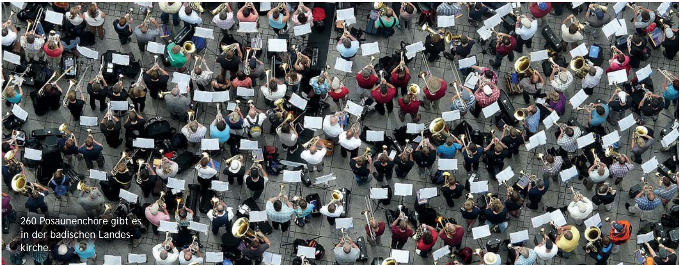
260 Posaunenchoräle gibt es in der badischen Landeskirche.

Die Kollekte am heutigen Tag ist für die Landesposaunenarbeit bestimmt: „Wir blasen Töne der Hoffnung.“ So halten es in der gesamten badischen Landeskirche etwa 5.500 Bläserinnen und Bläser in 260 Posaunenchorälen. Sie bringen Gottes Wort und Gegenwart musikalisch in die Welt. Sie tun das in Gottesdiensten und bei Kirchenfesten, auf öffentlichen Plätzen, in Krankenhäusern und auf Fried-