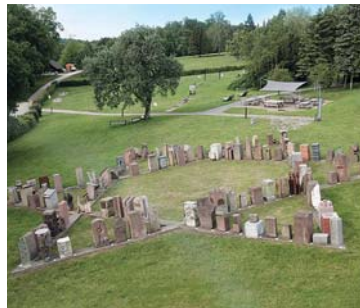
Das Mahnmal in Neckarzimmern

Im Herbst 2020 jährt sich zum 80. Mal die Deportation der badischen jüdischen Bevölkerung ins französische Internierungslager Gurs. Über 6.500 Männer, Frauen und Kinder wurden vom 22. auf den 23. Oktober 1940 von den Nationalsozialisten verschleppt; die meisten von ihnen kamen in Gurs und seinen Nebenlagern und später im Vernichtungslager Auschwitz ums Leben. Aus diesem Anlass sind – in Verantwortung der Arbeitsstelle Frieden in Kooperation mit der Erzdiözese Freiburg und dem Förderverein Mahnmal Neckarzimmern – übers Jahr verschiedene Gedenk-Veranstaltungen und Angebote für und in Gemeinden geplant.