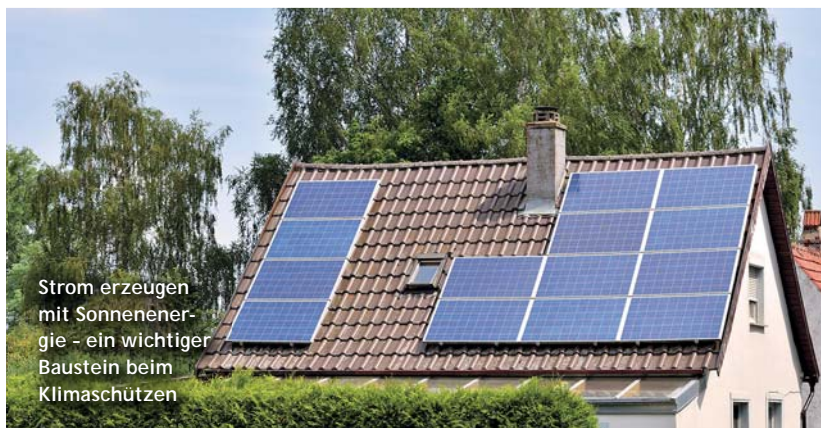
Strom erzeugen mit Sonnenenergie - ein wichtiger Baustein beim Klimaschutz