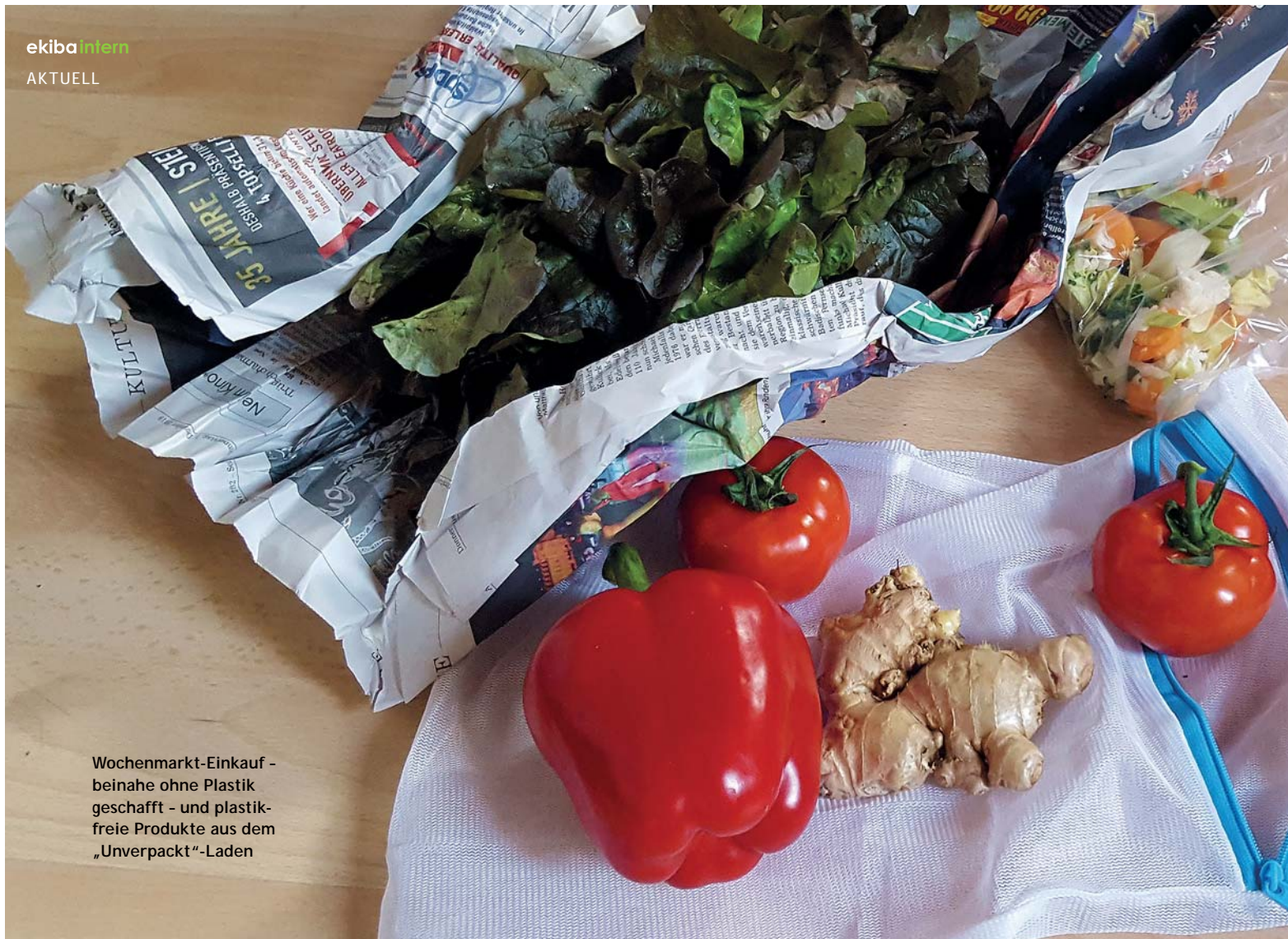
Wochenmarkt-Einkauf - beinahe ohne Plastik geschafft - und plastik- freie Produkte aus dem „Unverpackt“-Laden