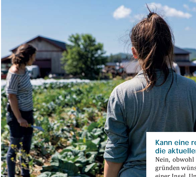
Flächendeckender Öko-Landbau wäre wünschenswert, würde aber die Produkte teurer machen.