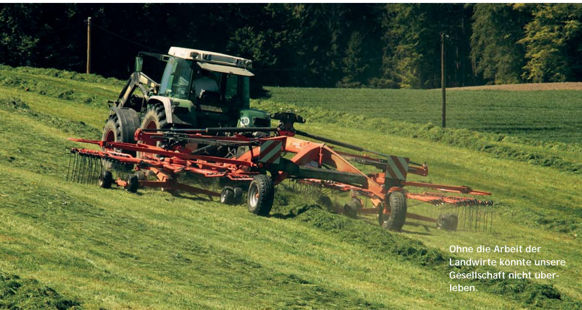
Ohne die Arbeit der Landwirte könnte unsere Gesellschaft nicht überleben.

Als Firmen genveränderten Mais ausäten, wurden Felder besetzt, Mahnwachen und ökumenische Gottesdienste vor Ort organisiert und mit fundierten Stellungnahmen protestiert. Nach einem langwierigen politischen Prozess beschloss die EU, kein gentechnisch verändertes Saatgut zu verwenden. Das gilt heute noch. Aktuell steht die Diskussion um Artenschutz und Artenvielfalt im Mittelpunkt, das Volks-