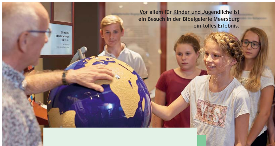
Vor allem für Kinder und Jugendliche ist ein Besuch in der Bibelgalerie Meersburg ein tolles Erlebnis.