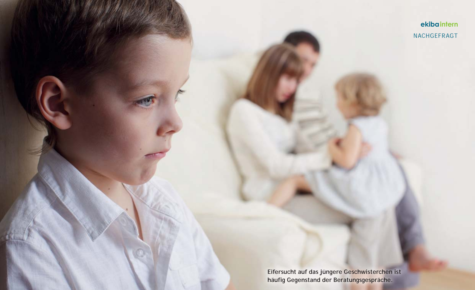
Eifersucht auf das jüngere Geschwisterchen ist häufig Gegenstand der Beratungsgespräche.

zung aus. Bei massiven Schwierigkeiten werde eine zweite Sitzung vereinbart – und die Familie auf Wunsch ggf. an die Leimener Zweigstelle der Beratungsstelle vermittelt: „Beispielsweise bei größeren Emotionsregulationsproblemen, also wenn ein Kind durch extreme Wutanfälle oder aggressives Verhalten auffällt.“