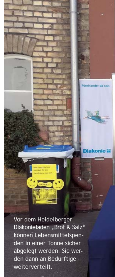
Vor dem Heidelberger Diakonieladen „Brot & Salz“ können Lebensmittelspenden in einer Tonne sicher abgelegt werden. Sie werden dann an Bedürftige weiterverteilt.