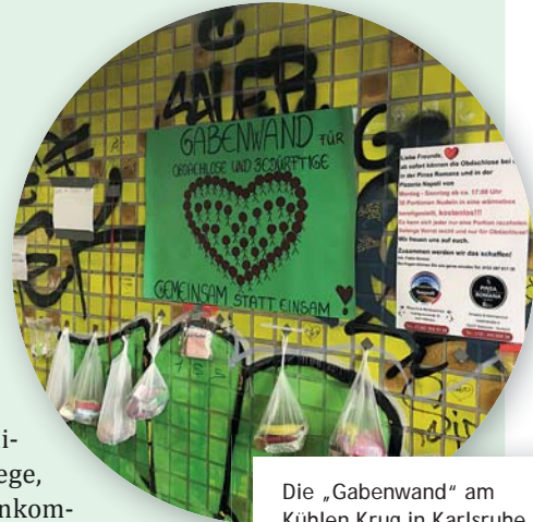
Die „Gabenwand“ am Kühlen Krug in Karlsruhe macht Mut.

Die Diakonie Baden nimmt dabei die Bedürftigen in Baden in den Blick: zum Beispiel Obdachlose oder Familien, in denen Kinderarmut herrscht. Die Landeskirche bittet um Unterstützung in den Ländern, die noch stärker von der Corona-Krise betroffen sind, weil die wirtschaftlichen Rahmenbedingungen schlechter sind. Über die Evangelische Mission in Solidarität (ems) und die Partnerkirchen gibt es Wege, Spenden so weiterzuleiten, dass sie verlässlich ankommen, Not lindern und Gutes bewirken können.