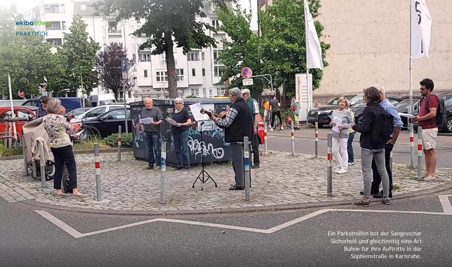
Ein Parkstreifen bot der Sangesschar Sicherheit und gleichzeitig eine Art Bühne für ihre Auftritte in der Sophienstraße in Karlsruhe.