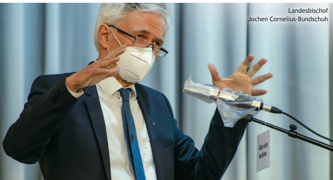
Landesbischof Jochen Cornelius-Bundschuh