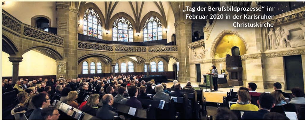
„Tag der Berufsbildprozesse“ im Februar 2020 in der Karlsruher Christuskirche