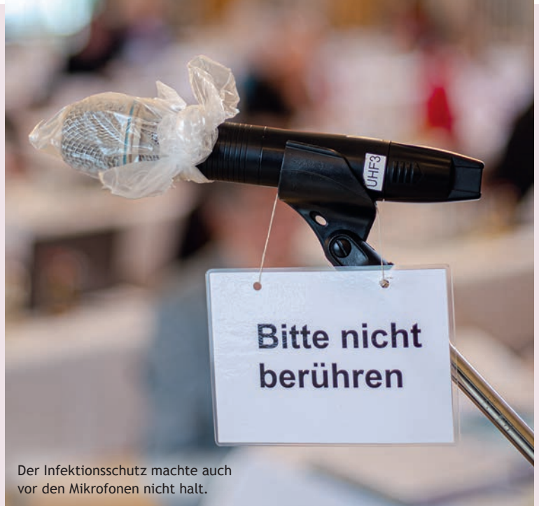
Der Infektionsschutz machte auch vor den Mikrofonen nicht halt.