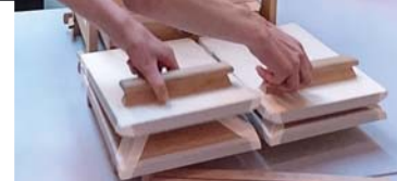
Mit zwei Blasebälgen wird Luft in das Instrument getrieben.