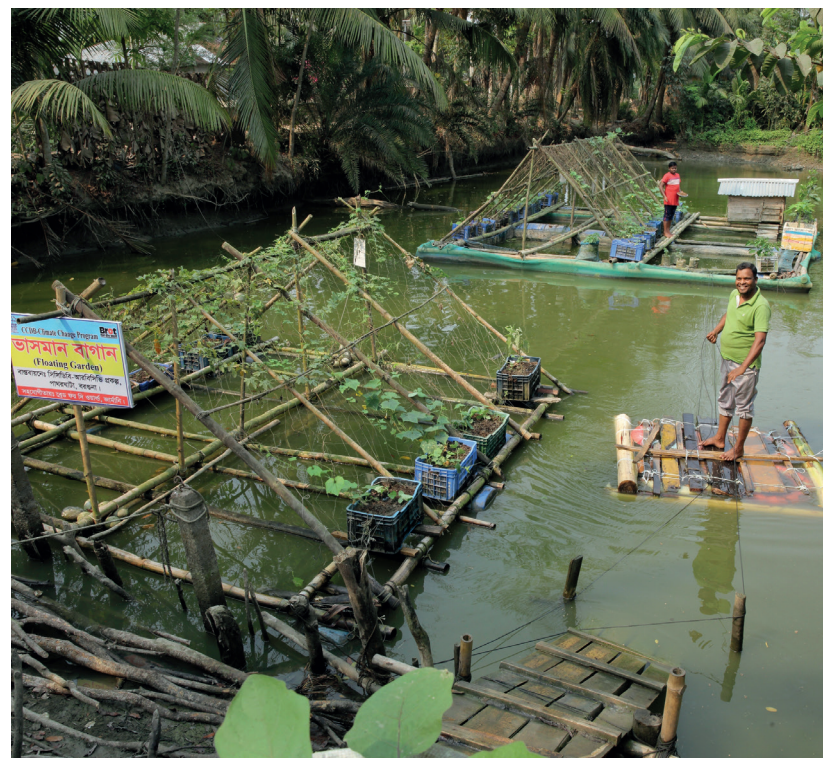
Schwimmende Gärten in Bangladesch