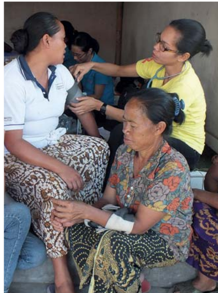
Ein mobiler Dienst ergänzt die Krankenhausarbeit. Mehrere Fachkräfte bieten regelmäßige Sprechstunden in abgelegenen Orten an, wo es keine andere medizinische Versorgung gibt.