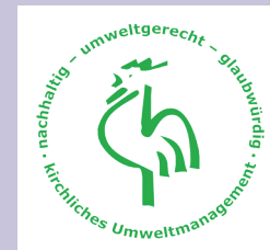
Gütesiegel der Diakonie Baden: EMAS-Zertifizierung und Landeskirchlicher Grüner Gockel