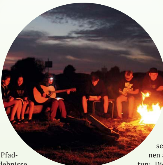
Abendliches Singen am Lagerfeuer

Äußerlich springt beim Betrachten einer Pfadfindergruppe die einheitliche Kleidung ins Auge, die