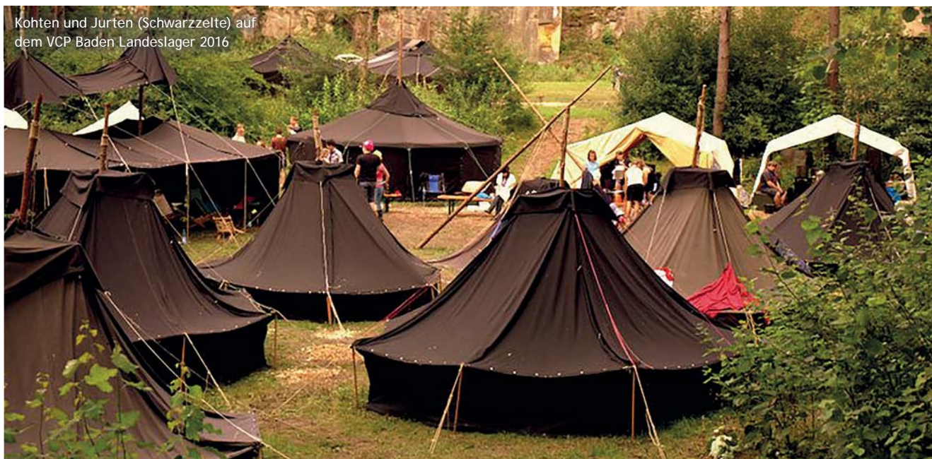
Kothen und Jurten (Schwarzzelte) auf dem VCP Baden Landeslager 2016