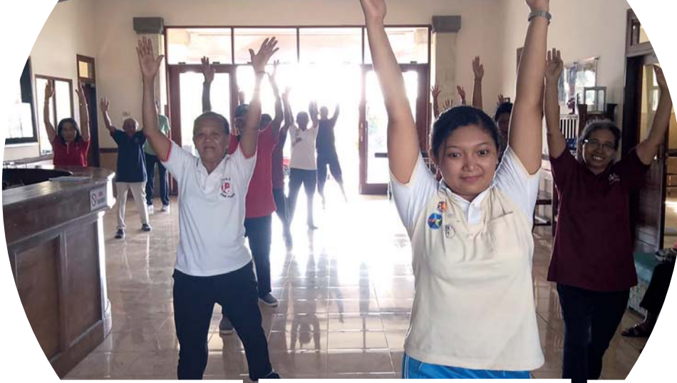
Die Bewegungstherapie für alte Menschen an einer der Stiftungskliniken (s. auch unten) ist ganz neu auf Bali.