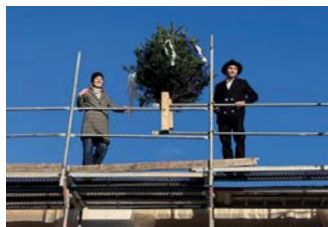
Richtfest der Kita Wallonenstraße in Mannheim-Friedrichsfeld

Der Neubau der künftigen Kita Wallonenstraße in Mannheim-Friedrichsfeld läuft ganz nach Plan. Der Holzbau mit Holzdach ist bereits komplett montiert. Die Lamellenschalung der Fassade mit Weißtanne folgt dieses Frühjahr.