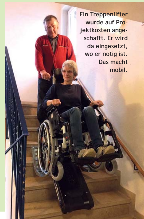
Ein Treppenlifter wurde auf Projektkosten angeschafft. Er wird da eingesetzt, wo er nötig ist. Das macht mobil.

weiter entfernte Städte wie Lörrach zum Arzt kommen. Mobilität ist ein wichtiges Standbein des Projekts, weil sie Voraussetzung für Gemeinschaft ist. Was tun, wenn man abgelegen wohnt, wie viele an den Rändern des Wiesentals, und das Autofahren zu anstrengend wird oder nachts nicht mehr möglich ist? Ein vernünftiges Konzept steht schon lange, muss aber umgesetzt werden.