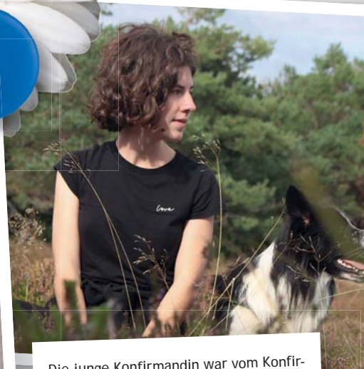
Die junge Konfirmandin war vom Konfirmandenunterricht begeistert. Er war so abwechslungsreich und hat ihr gezeigt, dass Kirche nicht altmodisch ist.

„ Das Verhältnis zum Pfarrer war von großem Respekt geprägt.“