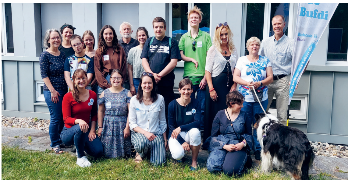
Team Inklusiver Freiwilligendienst mit Freiwilligen

Ein FSJ-Angebot der Diakonie Baden fasst zunehmend Fuß.