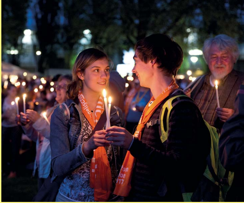
Abendsegens beim Kirchentag 2017 in Berlin