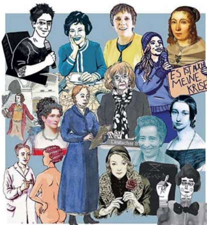
Rebellen – Frauen verändern die Welt

phie Scholl, die Reformatorin Argula von Grumbach, die Schauspielerin Marlene Dietrich und die Verlegerin Aenne Burda. Die Ausstellungstafeln bilden historische Dokumente ab, Auszüge aus Interviews, Tagebüchern oder Publikationen. Für die Schau haben renommierte Künstlerin-