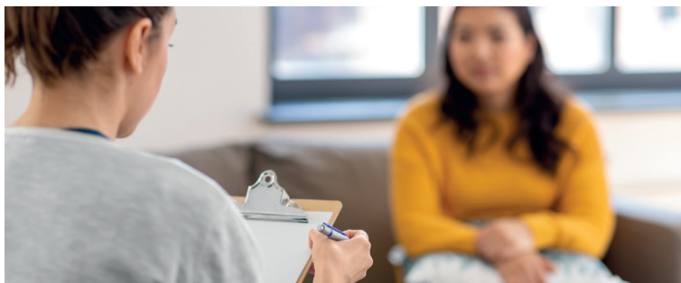
Beratungsgespräche helfen bei der Antragsstellung.