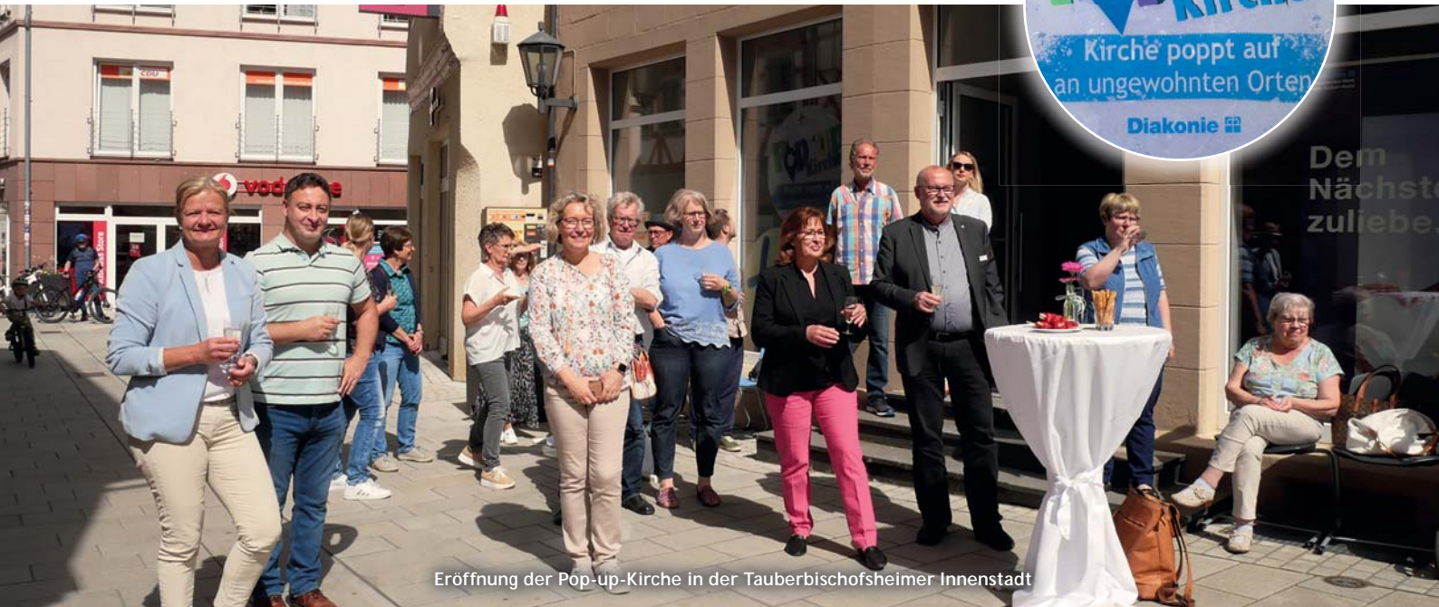
Eröffnung der Pop-up-Kirche in der Tauberbischofsheimer Innenstadt