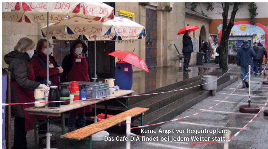
Keine Angst vor Regentropfen: Das Café DIA findet bei jedem Wetter statt.

„ Allein, dass wir da sind, ist für die meisten schon ein großer Trost. “