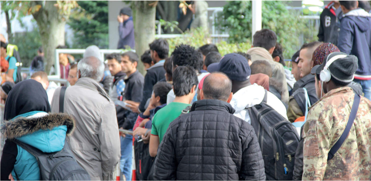
2022 gilt als Flüchtlingsjahr. Hier: die Ankunft von Flüchtlingen in Karlsruhe.

den von der Diakonie intensiv begleitet. Eindringlich fordern wir ein Suizidpräventionsgesetz mit flächendeckenden Beratungsstellen für Menschen in suizidalen Notlagen. Wir setzen uns dafür ein, dass dies in die weiteren Lesungen des Gesetzes zum Ende des Jahres 2022 mitaufgenommen wird.