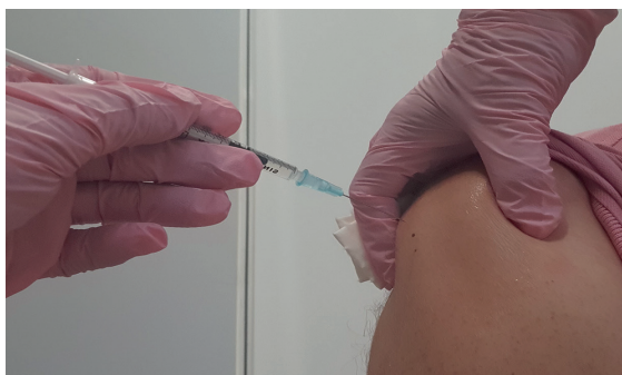
Ein Beispiel für Diskriminierung und mangelnde Wertschätzung der verantwortungsvollen Arbeit von Pflegekräften: die einrichtungsbezogene Impfpflicht.

toppt wurde dies nur noch durch die Maskenpflicht für Bewohner*innen, die in ihren gemeinsamen Lebensbereichen Masken tragen mussten, während man sich in den bierdünstigen Festzelten schunkelnd in den Armen liegen konnte. Auch wenn sie jetzt Vergangenheit ist, wir als Diakonisches Werk Baden hatten mit unseren Einrichtungen dagegen protestiert, zeigt sich auch darin ein grundsätzli-