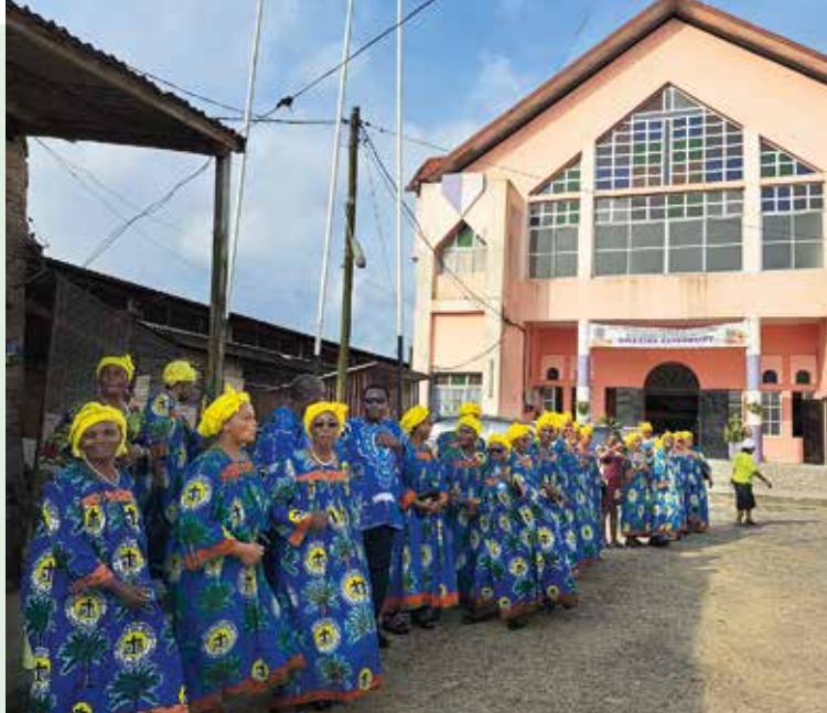
Jeder Empfang der Gäste wurde zum Fest.

ten viel bewegen. Es herrscht großes Vertrauen. Damit können auch unangenehme Fragen auf eine geschwisterliche Weise gestellt werden. Und letztendlich leiden unter der Korruption die Kameruner zuallererst – sie müssen trotzdem in diesem Land weiterleben. An Grenzen stoßen Partnerschaften, wenn es einen Wechsel der Bezugspersonen gibt. Sei es, dass der Dekan wechselt, oder sich das Partnerschaftskomitee in Deutschland neu aufstellen muss.