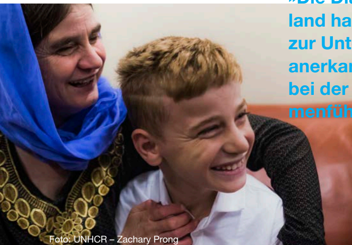
Familienzusammenführung in Winnipeg, Kanada

»Die Diakonie Deutschland hat einen Fonds zur Unterstützung anerkannter Flüchtlinge bei der Familienzusammenführung aufgelegt.«