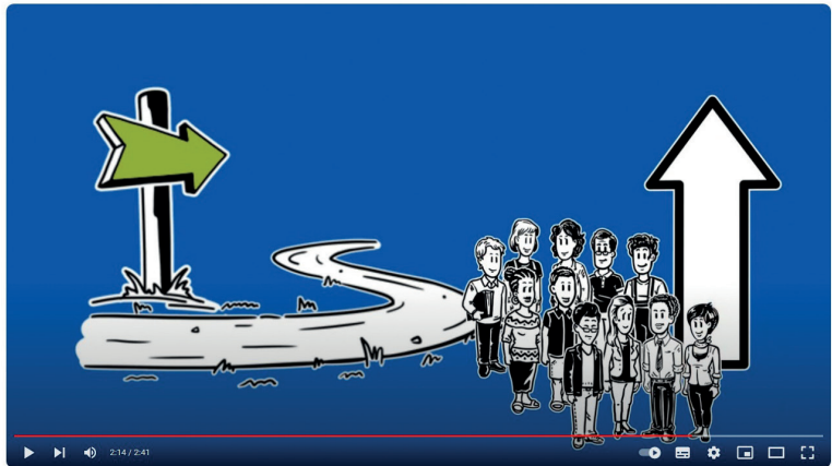
Erklärvideo auf Youtube

jetzt und zukünftig entscheidend sind, um wettbewerbsfähig bleiben zu können. Ein Matchingtool hilft beim Kompetenzabgleich. Ist bereits jemand im Unternehmen, der oder die auf die geänderte Anforderung passen könnte? Bringt vielleicht jemand gute Ansätze für eine andere Tätigkeit mit und kann durch gezielte Anpassungsqualifikation schon bald loslegen? Vielleicht kann aber auch jemand aus gesundheitlichen Gründen der ursprünglichen Arbeit nicht mehr nachkommen oder möchte sich verändern – wie kann er dem Unternehmen erhalten bleiben? Auch hier kann Kompetenzscouting zur konstruktiven Lösung beitragen, indem man Orientierung darüber erhält, wo die Person alternativ eingesetzt werden könnte. Sechs Mitgliedseinrichtungen der Diakonie waren an der Entwicklung beteiligt. Alle Prozessschritte wurden hierbei durch das Projektteam umgesetzt. In der Erprobungsphase kamen fünf neue Mitgliedseinrichtun-