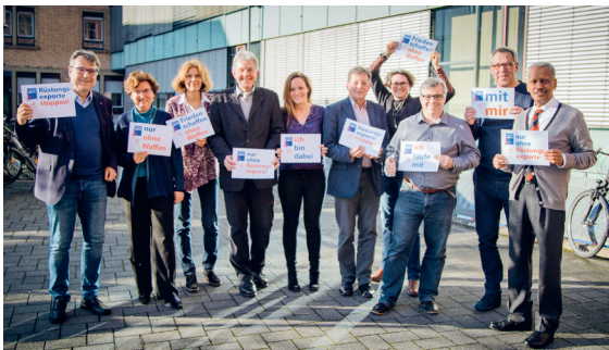
Steuerungsgruppe im Evang. Oberkirchenrat