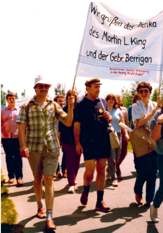
Mitglieder des AK Soziale Verteidigung bei einer Großdemonstration gegen die NATO-Nachrüstung am 10.6.1982 in Bonn