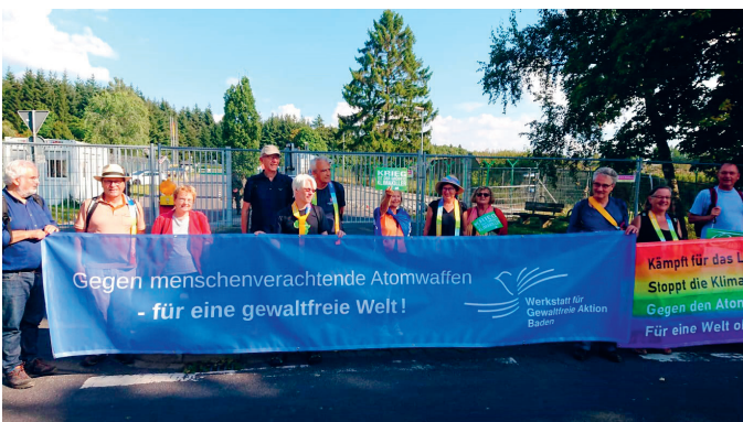
Aktion in Büchel