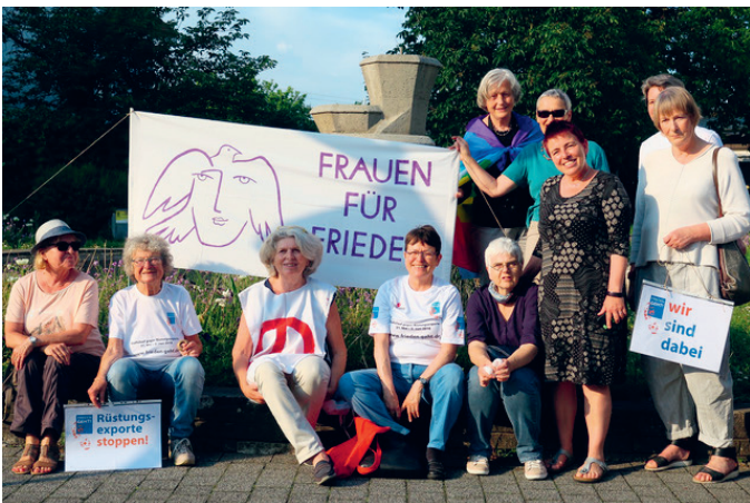
Frauen für Frieden bei Frieden geht 2018

Verabschiedet am Montag, den 8. Mai 2023 in Karlsruhe