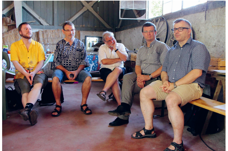
Koordinationskreis Treffen in Offenburg

Das Präsidium der Landessynode entschied gemeinsam mit dem Evangelischen Oberkirchenrat, sich auf einen solchen Beratungsprozess einzulassen. Der daraufhin von einer friedensethisch profilierten Arbeitsgruppe 2012 erstellte „Entwurf eines Positionspapiers zur Friedensethik der Evangelischen Landeskirche“ wurde bis ins Jahr 2013 in 23 von 25 Kirchenbezirken beraten. Manche Synoden stimmten darüber einfach ab, andere verfassten eigene Statements. Es gab Podiumsgespräche zwischen Pazifisten*innen und Vertretern der Militärseelsorge. Politiker*innen und Theolog*innen wurden zu Veranstaltungen unterschiedlichen Formats eingeladen. Es referierten Vertreter*innen des Forums Friedensethik in der Landeskirche (FFE), der Arbeitsstelle Frieden im Evangelischen Oberkirchenrat, der Theologischen Fakultät in Heidelberg sowie von der Forschungsstätte der Evangelischen Studiengemeinschaft (FEST).