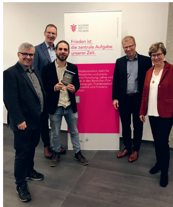
Präsentation des Buches Heilsam in Freiburg 2023

Im Jahr 2023 unterstützte das Friedensinstitut auch die Veröffentlichung des Buches „Heilsam mit traumatischen Erlebnissen umgehen“ von Carolyn Yoder auf Deutsch und bot zum Thema „Einführung in die traumsensible Friedensarbeit“ Ende 2023 einen Studientag an.