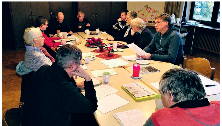
Koordinierungskreistreffen in Offenburg