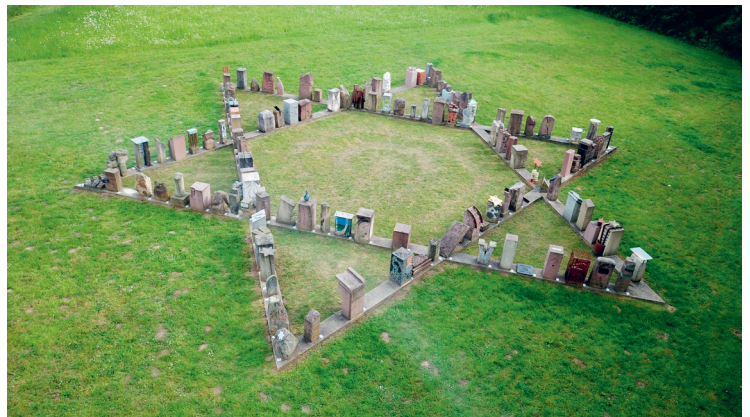
Mahnmal in Neckarzimmern