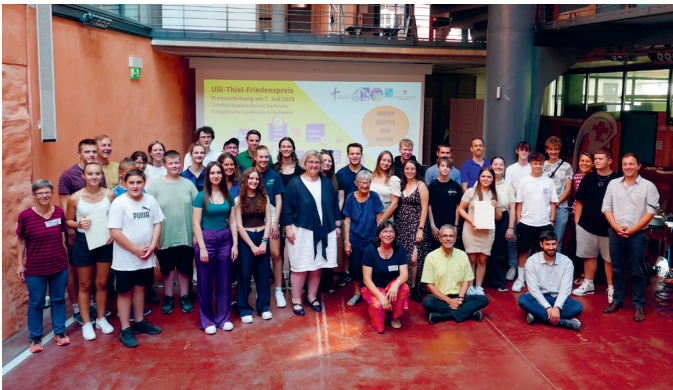
Bischöfin und Preisträger*innen 2023

Der Ulli Thiel-Friedenspreis ist ein Wettbewerb für Schüler*innen, Lehrer*innen und Schulen in Baden-Württemberg. Er richtet sich an alle Schulen und Klassenstufen in Baden-Württemberg und wird seit 2019/20 von der Evangelischen Landeskirche in Baden gemeinsam mit der Deutschen Friedensgesellschaft-Vereinigte