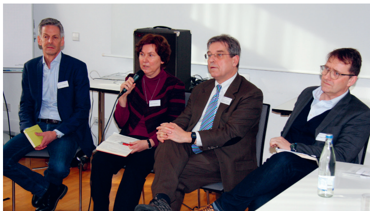
Studententag „Just Policing“ in Rastatt 2017

polizeiliche Zwangsmaßnahmen vor. Um die Chancen und Grenzen von „Just Policing“ genauer zu untersuchen, gab die Badische Landeskirche bei der Heidelberger Forschungsstätte FEST eine Studie in Auftrag, die im Jahre 2017 der Öffentlichkeit vorgestellt wurde: „Just Policing – eine Alternative zur militärischen Intervention?“ Die Autorin Ines-Jacqueline Werkner untersuchte am Beispiel des Afghanistankriegs die verschiedenen Interventionsmöglichkeiten und arbeitete besonders die Unterschiede zwischen polizeilicher und militärischer Gewalt heraus. Zudem unterstrich die Studie die Forderung, dem Bereich Konfliktprävention künftig eine deutlich größere Bedeutung zuzumessen. Denn am Beispiel des Afghanistankrieges zeige sich, dass weder militärische noch polizeiliche Gewalt in der Lage gewesen seien, den Konflikt zu befrieden. Die Ergebnisse der Studie flossen zu einem späteren Zeitpunkt in die Fachgruppe „Internationale Polizei“ ein. 14