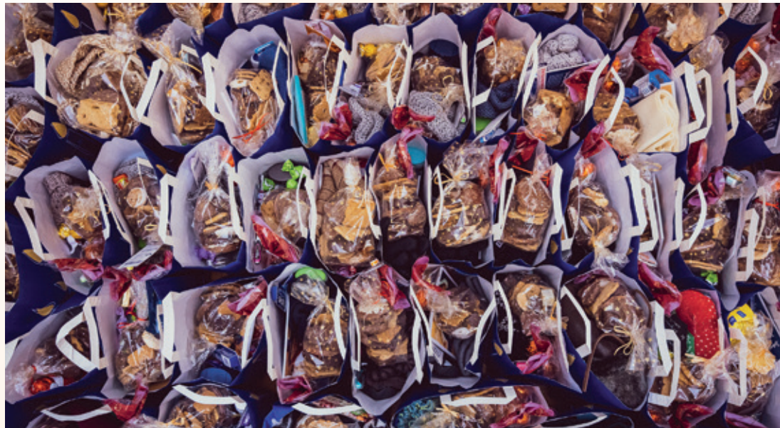
Geschenktüten der Citykirche Konkordien