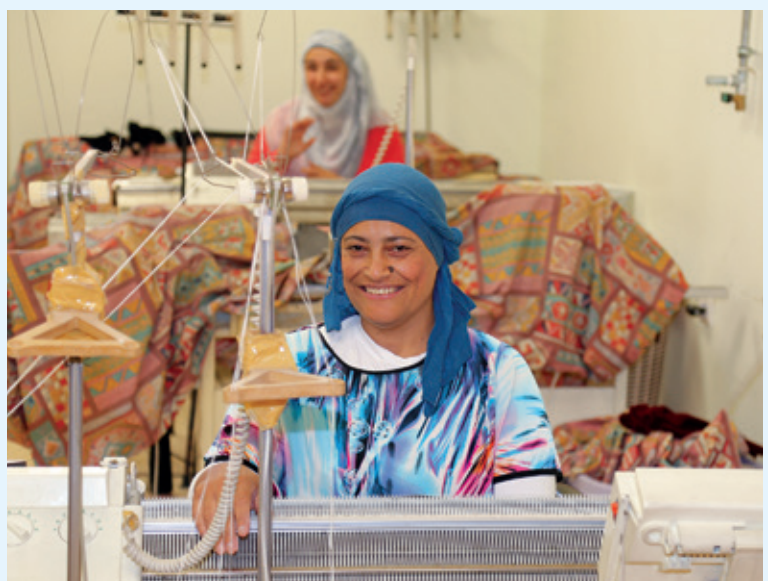
Bei Lifegate in der Stadt Beit Jala (Westjordanland) können Frauen eine Ausbildung erhalten und haben so die Möglichkeit, zum Familienunterhalt beizutragen.