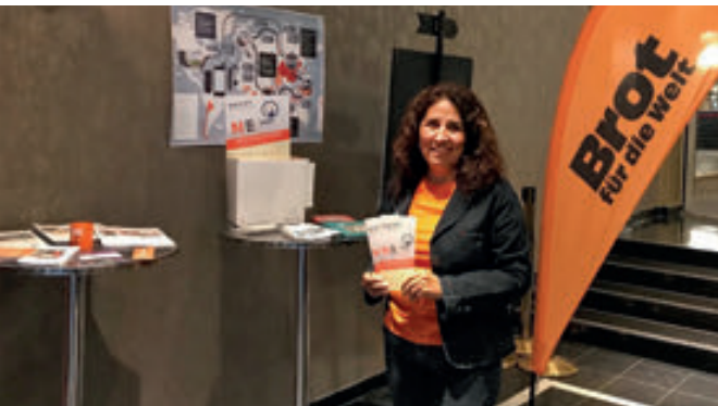
Handy-Sammel-Aktion im Kino Schauburg, Karlsruhe Eine Handy-Sammelbox finden Sie in der Diakonie Baden, Vorholzstr. 3, Karlsruhe

Die evangelische Kirchengemeinde Ladenburg hatte am 2. Dezember zu einem Filmabend mit dem Film „Vergiftete Wahrheit“ eingeladen. Am Beispiel des Spielfilms und eines Hilfsprojekts von Brot für die Welt wurden die Folgen des technischen Fortschritts auf Umwelt und Gesundheit thematisiert. Am Sonntag dann wurde in einem Gottesdienst mit Posaunenchor die 65. Aktion in Baden feierlich eröffnet.