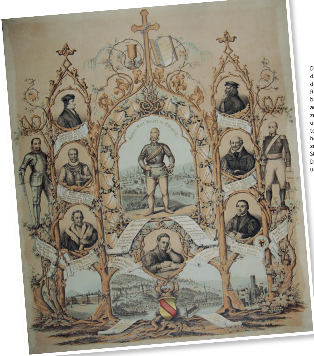
Das Gedenkblatt an das dritte Jubiläum der evangelischen Reformation in den badischen Landen aus dem Jahr 1856 zeigt Markgraf Karl II. umringt von Reformatoren und Landesherren. Im Hintergrund zu sehen sind die Stadtansichten Durlach, Heidelberg und Wertheim.

Fotos: Privat; Landeskirchliches Archiv Karlsruhe, Bestand 153; Grafik- und Gemäldesammlung, Nr. 76; Gedenkblatt an das dritte Jubiläum der evangelischen Reformation in den badischen Landen (1856)