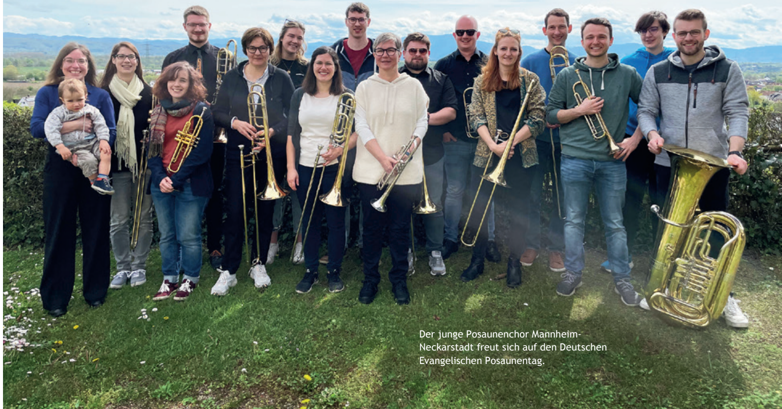
Der junge Posaunenchor Mannheim-Neckarstadt freut sich auf den Deutschen Evangelischen Posaumentag.