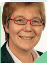
SWR 1, Anstöße Ute Haizmann, Weinheim

„ Ostern entwaffnet. Da steht nicht nur etwas von Engel, leerem Grab, Licht und überraschten Jüngerinnen und Jüngern Jesu. Da wird auch erzählt, dass die bewaffneten Wächter des Grabes Angst bekommen und ohnmächtig umfallen. Gerade die Leute mit den Waffen stehen an Ostern auf verlorenem Posten.“