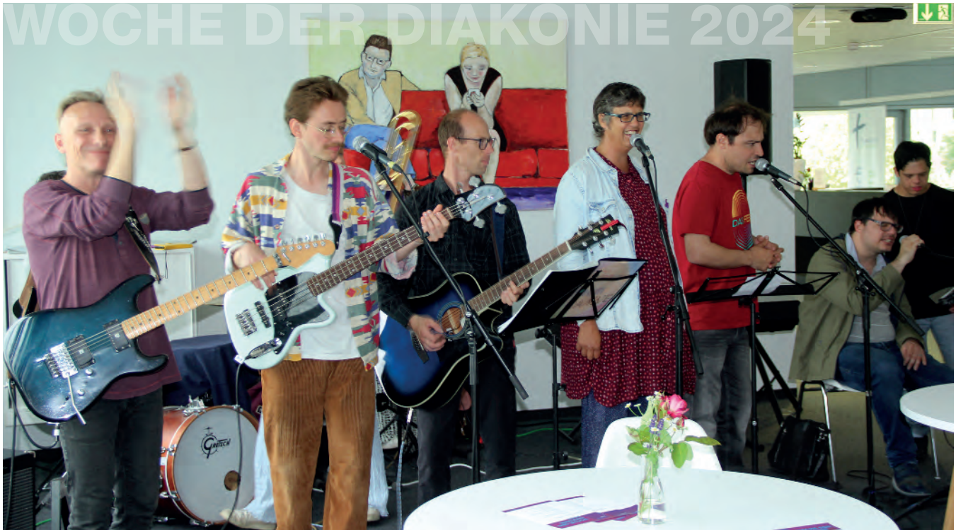
Die inklusive Band Tonraum sorgte für beste Stimmung