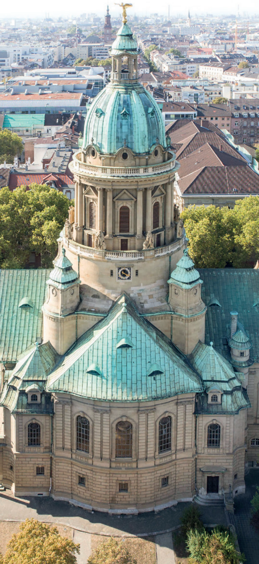
Die Mannheimer Christuskirche von außen ...

„Kostenlose Konzerte, bei denen um eine freiwillige Spende gebeten wird, zum Beispiel zur Unterstützung der Kirchenmusik. Dort wollen wir es auch testen und gucken, wie praktikabel es ist.“