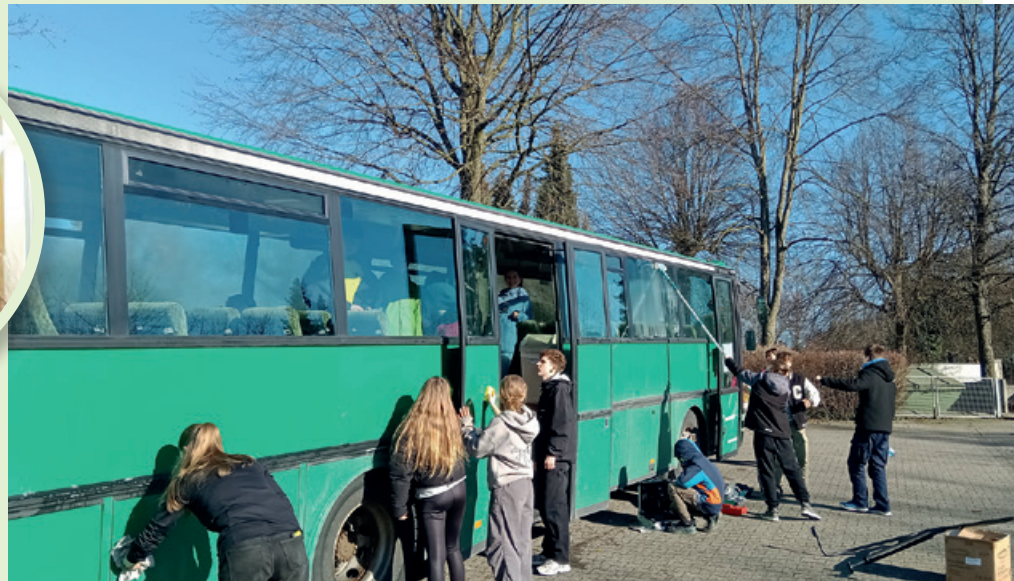
... geputzt, geschraubt und gehämmert.