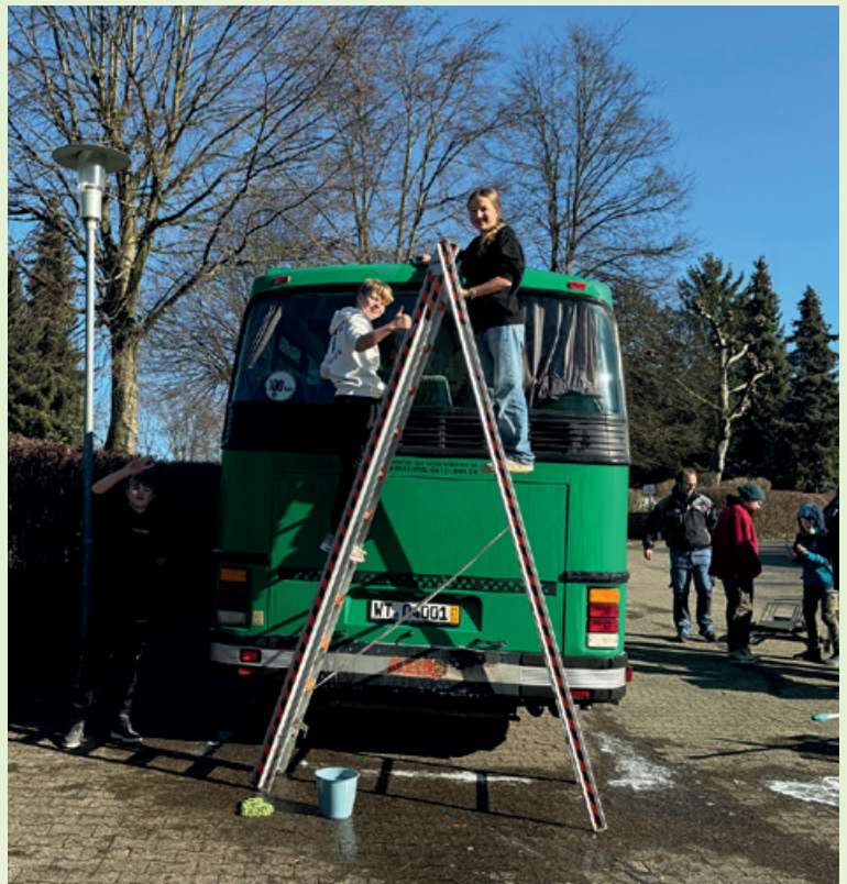
Seit vergangenem Oktober wird an dem Bus ...

Mit 240.000 Kilometern auf dem Tacho ist der grüne Bus der sächsischen Polizei schon weit herumgekommen. Nun steht er in Südbaden noch einmal am Beginn einer neuen Reise. In Jestetten im Kreis Waldshut bauen Jugendliche und Handwerker aus dem Bus ein fahrbares Jugendzentrum.