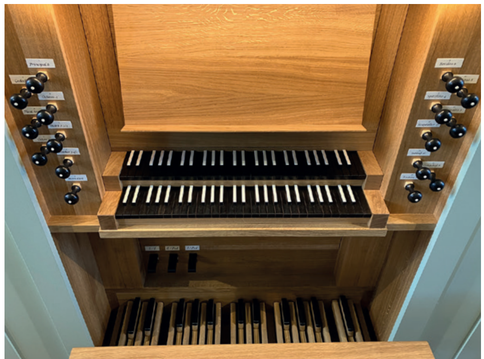
Bilder: Vector-Tradition, adobe stock; Tilman Trefz; Martin Kares