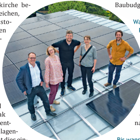
Installation einer Solaranlage auf der Kita in Bad Schönborn