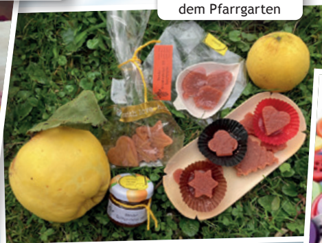
Selbstgemachtes aus dem Pfarrgarten