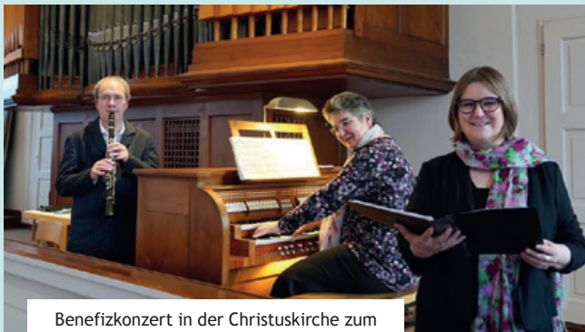
Benefizkonzert in der Christuskirche zum 15-jährigen Jubiläum der Kirchenstiftung

Aktuell hat die Stiftung besonders im Blick, in den Sozialen Medien sichtbarer zu werden, um noch bekannter in der Öffentlichkeit zu sein und sich mit anderen Stiftungen zu vernetzen und auszutauschen.