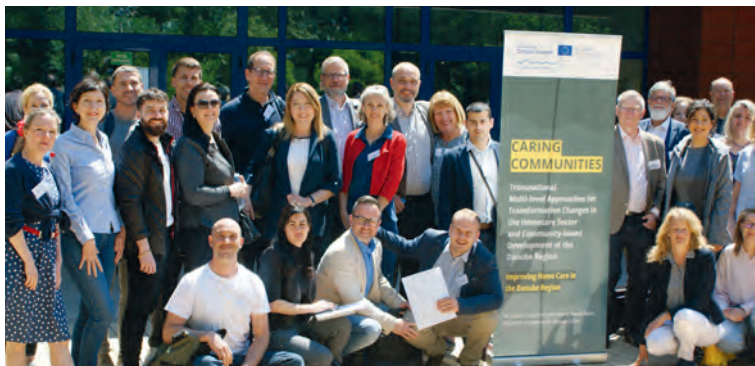
Die Projektbeteiligten beim Summit in Ruse/Bulgarien, Mai 2025